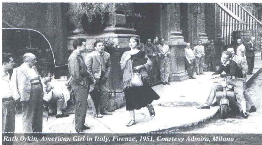
Ruth Orkin, American Girl in Italy, Firenze, 1951, Courtesy Admira, Milano

MIA Fair – Milan Image Art Fair 2013 Dal 10 Al 12 Maggio Milano, Superstudio Più Via Tortona, 27