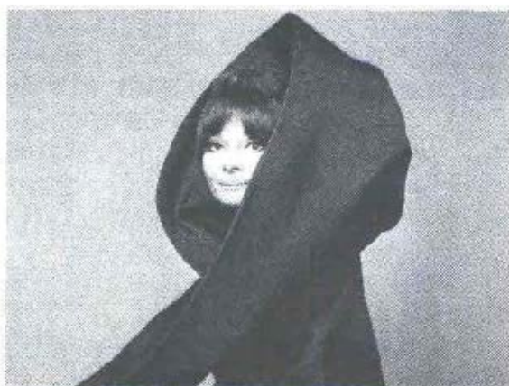
Gian Paolo Barbieri, Audrey Hepburn per Valentino, Vogue Italia, Roma 1969